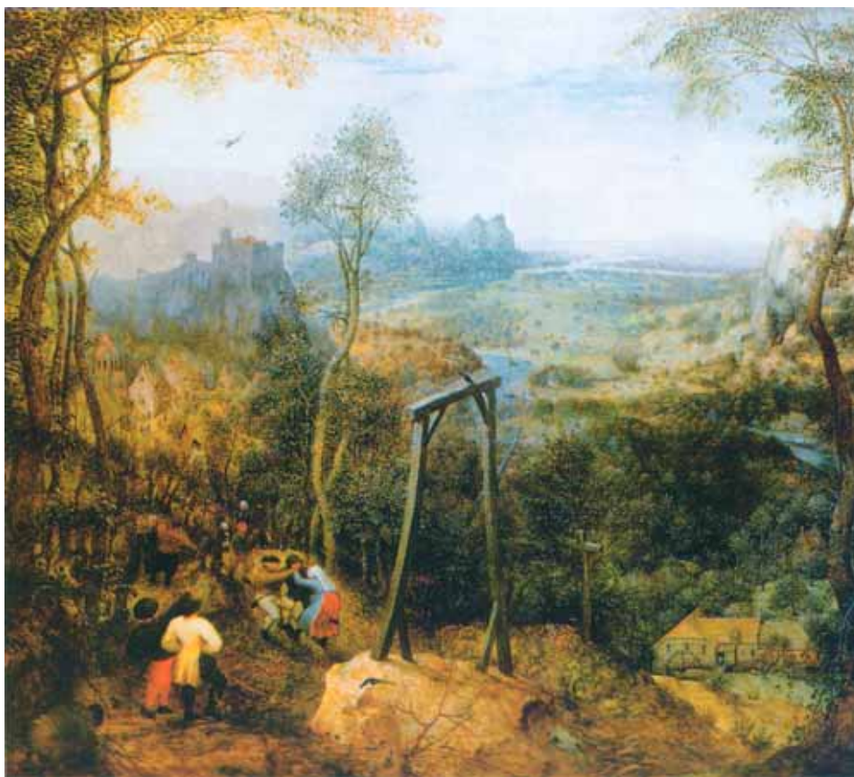
Pieter Bruegel Starszy, Taniec pod szubienicą , 1568 r., olej na desce, 45,9 x 50,8 cm, Hessisches Landesmuseum, Darmstadt