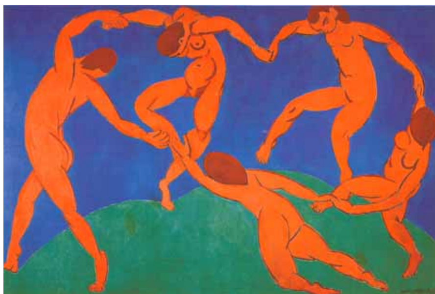
Henri Matisse, Taniec , 1910 r., olej na płótnie, 260 x 391 cm, Ermitaż, Sankt Petersburg