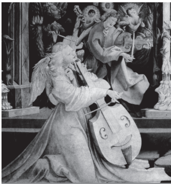
Musée d'Unterlinden w Colmarze

Podaj nazwy dwóch odmian wioli, na których grają aniołowie przedstawieni na ilustracji.