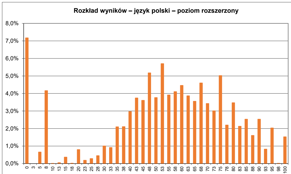
TABELA 9. WYNIKI ZDAJĄCYCH – PARAMETRY STATYSTYCZNE*